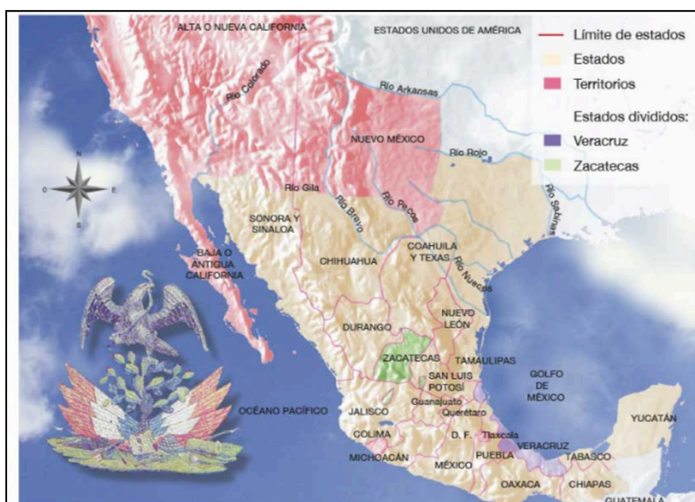
Imagen-1. Tomada del libro de 5° grado de Primaria, división territorial de la República en 1824:

La Imagen-1 muestra la división territorial de los Estados Unidos Mexicanos en 1824.